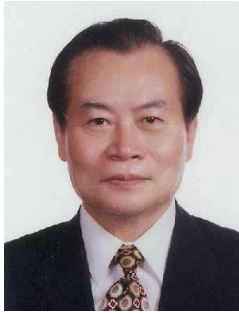
姓名：曾勇夫 學籍：高中部 75 年畢 學歷： 台灣大學法律系 事蹟： 中華民國法務部主秘、政務次長、最高法院檢察署主任檢察官、法務部長。