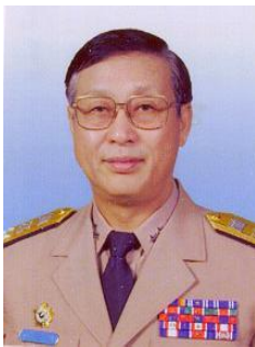
姓名：劉金陵 學籍：高中部 52 年畢 事蹟： 中山科學研究院院長