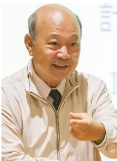
姓名：張宗仁 學籍：高中部 53 年畢 學歷： 美國科羅拉多大學化學研究所博士 事蹟： 高雄大學副校長、國立中山大學校長、嘉南藥理大學講座教授。