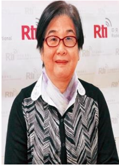
姓名：曠湘霞 學籍：高中部 58 年畢 事蹟： 中國電視公司副總經理、前中央廣播電台董事長。