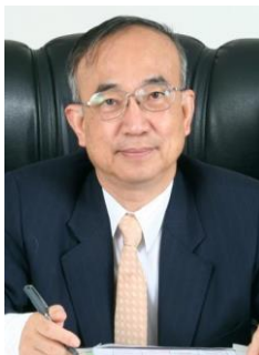
姓名：蘇炎坤 學籍：初中部 53 年畢 學歷： 紐約州立大學水牛城分校數學博士 事蹟： 崑山科技大學校長、國科會工程發展處處長、成大電機系教授、成功大學名譽講座教授。