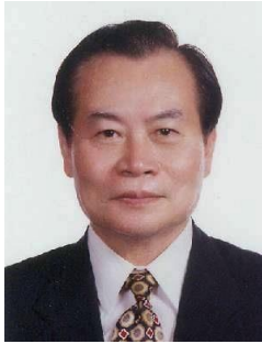
姓名：曾勇夫 學籍：高中部 51 年畢 學歷： 台灣大學法律系 事蹟： 中華民國法務部主秘、政務次長、最高法院檢察署主任檢察官、法務部長。