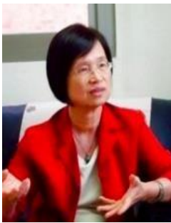
姓名：卓春英 學籍：高中部 61 年畢 事蹟： 高雄縣副縣長