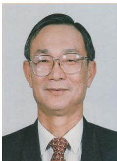
姓名：簡仁德 學籍：高中部 52 年畢 事蹟： 交通部電信總局局長