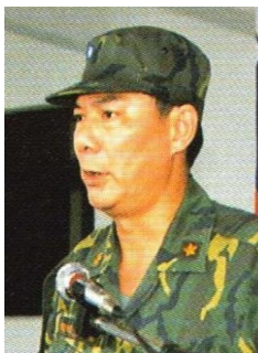
姓名：張林生 學籍：高中部 55 年畢 事蹟： 陸軍第八軍團中將副司令、陸總部後勤部司令。